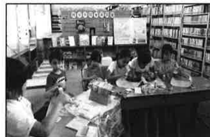
明木／「カラフルコースターを作ろう」