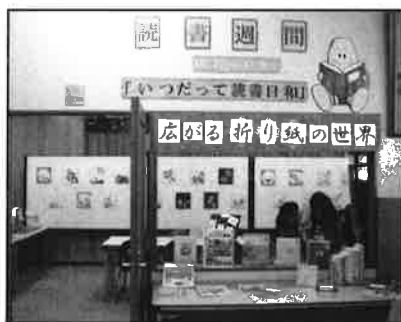
須佐／「折り紙作品展」