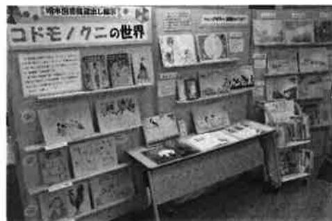
明木／「蔵出し展示 コドモノクニの世界」