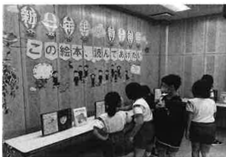
須佐／「新一年生から新一年生へ」