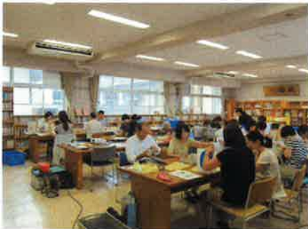
萩／出前講座「本の修理」