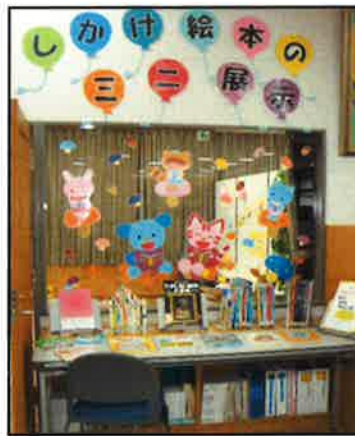
須佐／「しかけ絵本のミニ展示」