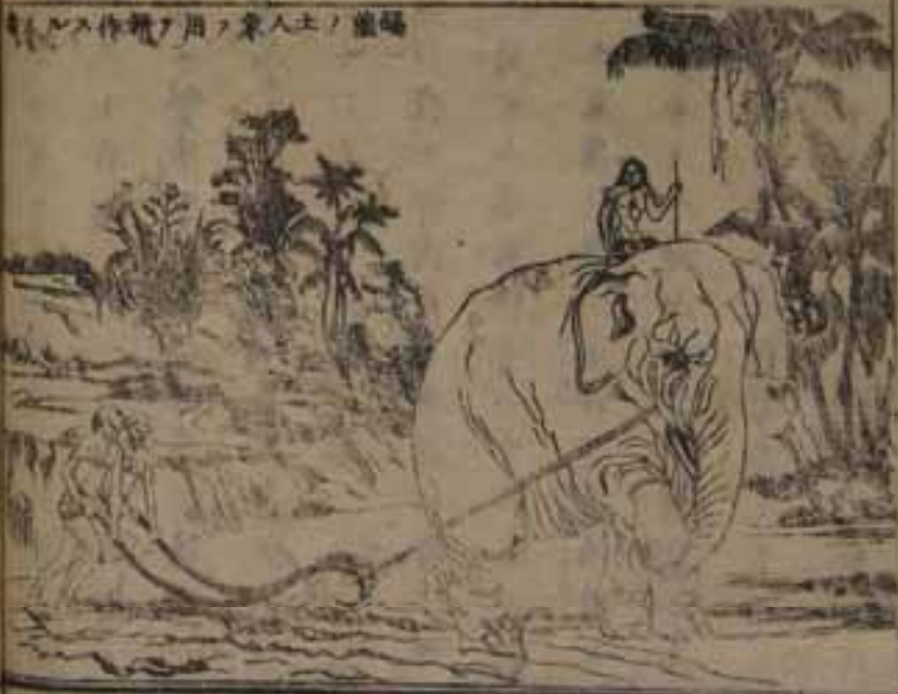
錫蘭島ノ人ト象トノ用テ作ル

一陸ニ島山多シト雖ハ昔既ノ地ニ少クナリ山ノ實 不及其地ノ半シ此中ノ人ト名ノ木村ハ堅 ノ年積ノ用ヲ可シ近年咖啡ノ産メ物ノ殊ニ 毎式輸出ノ額三十餘万有ニ過ク島中ニ象多シ因テ象 牙ノ肉ハ熟レ他地方ノ産ニ比テバ其形大ナラズ 岸ノ陸地ト相對スル峡中ニ野レケ真珠ノ産メ西岸ニ 可倫坡府領ト即チ島東ノ南端ノリ入ル島ノ東岸 ノ西向東ニ在ル其ノ地要トシ海港トシ此島ノ西 四年余年前輝之教法ヲ修レタル地ニシテ佛堂寺近有 事ト人皆佛教ヲ尊信スル事ナリ 印度地方共領ノ外佛蘭西葡荷西四ノ領地ニ許有