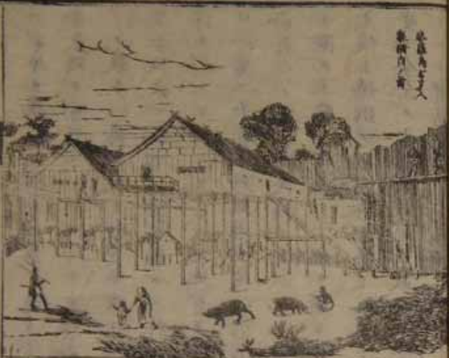
此圖為支那人 所繪自其書