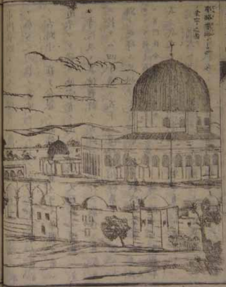
聖地牙哥 聖母瑪利亞

崇 レ 聖母 ノ 講 レ 風俗言語 ノ 其地 ノ 人氏 ノ 區別 無 レ ト雖 レ 現 レ 今 ニ 至 ル ハ レ 皆 テ 其 レ 固 レ 自 レ 教法 ノ 奉 之 レ 教 ノ 他 ノ 人氏 ト 相 レ 婚嫁 セ 蓋 シ 猶 レ 太 ノ 人種 ハ 甲 ノ 谷 ノ 俗 ハ 傳 レ 上 古 亞 ノ 細 ノ 亞 ノ 上 耳 其 ノ 中 ニ 一 レ 件 ノ 水 草 ヲ 逐 テ 轉 レ 居 ル ハ レ 野 ノ 蠻 ノ 力 レ シ カ 大 凡 三 千 八 百 年 前 ニ 其 ノ 酋 長 ノ 子 亞 ノ 伯 ノ 拉 ノ 罕 ト 云 フ 者 ハ 部 ノ 落 ノ 衆 ヲ 將 テ 之 レ 邊 ノ 南 ニ 移 リ 遊 牧 ス ル 亞 ノ 伯 ノ 拉 ノ 罕 ノ 數 ノ 子 有 リ 一 ノ 子 ト 及 ビ 耶 ノ 哥 ノ 伯 ノ 如 ク 其 ノ 父 ト 志 ヲ 繼 其 ノ 教 ヲ 奉 グ 故 ニ 猶 レ 太 ノ 於 テ 此 ノ 三 人 ノ 始 祖 ト 稱 之 レ 三 十 八 百 年 前 耶 ノ 哥 ノ 伯 ノ 子 約 色 ノ 弗 ノ 吳 ト 及 ビ 七 ノ 子 ト 二 事 ハ 其 親 ヲ 其 ノ 一 ノ 亞 ノ 非 ノ 利 ノ 加 ト 稱 ス 任 テ 其 ノ 後 ニ