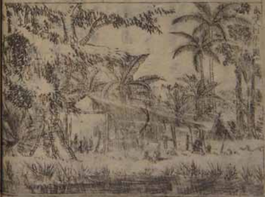
本城大正天皇御幸時御所

内地、皆高山屏列シ、川派乏シカ、大草木亦希、 水果百穀蕃生ス殊ニ山水秀美ナル、此島、以、 皮河、第一ノ稱、産物、咖啡、砂糖、米、穀、藍、青、椰、菜、生、姜、 胡椒、胡椒子、油、等、リ、名、物、製、造、局、有、リ、産、物、輸、出、 額、其、大、リ、リ、○、首、府、ノ、伯、帯、麻、亜、ト、系、南、緯、六、度、 三、分、位、西、北、岸、海、灣、在、リ、人、口、十、五、萬、餘、鐘、量、 尙、有、及、許、多、官、局、議、事、院、學、校、病、院、也、良、可、善、有、。、 内、政、務、皆、此、處、一、於、總、轄、街、間、市、店、依、雜、手、繁、盛、 道、路、亦、甚、清、潔、。、領、内、貿、易、首、座、。、 和、蘭、商、社、此、處、有、リ、且、府、内、廣、潤、。、。、人、家、相、接、迫、 々、於、庭、園、間、。、。、綠、葉、四、時、絶、々、百、花、常、爛、漫、。