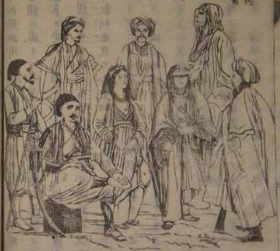
西印度及俄國 男女衣服之類

其東洲之國ト云フ義ニレテ其東方ニ位スルニ因テ 都川ノ土麥拿ト云ヒ西岸ノ海港ニ在リ亞細亞地方ト 耳其領ノ首府ニレテ國中最多ク人口多ク繁盛ナリ 且此國第一ノ海港ニレテ英佛澳米等ノ商船ハ港氣 貿易多ク入港ニ總額一歲一千九百萬弗ニ過 各國ノ公使皆此府ニ居住ス其他ノイナリ之府ノ亦交 易場ニレテ土麥拿ト二十八里ノ隔リ近來此兩府ニ制 鐵道ノ通スルニモ特ニ繁盛トナレリ 外ニ其地ニ道又スルモノ一ノ人口六萬許多ク製糖