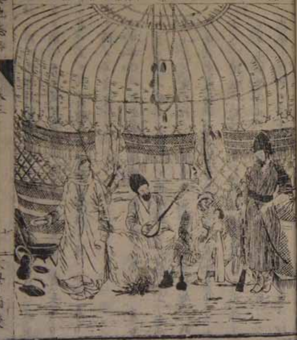
内幕帳人幾衆相聞

フルル、其地、俗尚以、准如スベシ、都下ノ士民ハ、古風、 温和ニ、及、談宴會等ノ事トシ、文學ヲ好シ、著述甚々 多ク、高妙ナル性理ノ學ヲ講求スル者有リ、且其詩學一 長スルヲ、往古ヨリ、宸著名ナル所ナリ、故ニ比耳西亞語 ハ、這國ニ傳ヘテ之ヲ、講習スルヲ、猶ホ佛蘭西語ノ歐洲 一於、ルカ如シト云○國內ノ人口大略三分、二ハ各地 一、都府村落ニ住シ、農商百工ノ業ヲ營ハト雖、其他ハ 遺牧ノ野民ニシテ、内地及東南ノ邊境ニ轉居シ、各隊ニ 結ヤシ、漫ク中ニ牧畜スルモノ、其數四百、下ラスト 云々、或ハ盜賊ヲ業トシ、隊商及邊土ニ住ス、農民ヲ抄 掠スル者、多クハ、世拉比亞人、都魯威人等、トテ尚