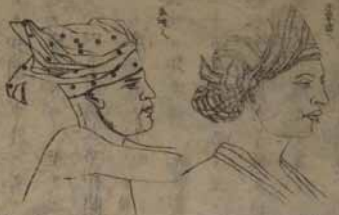
本城大正天皇御幸時御所