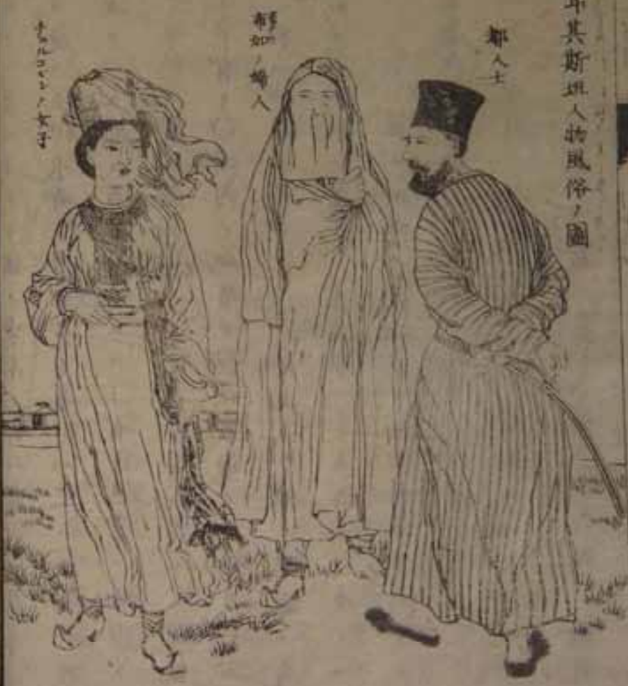
土耳其斯坦人的風俗圖