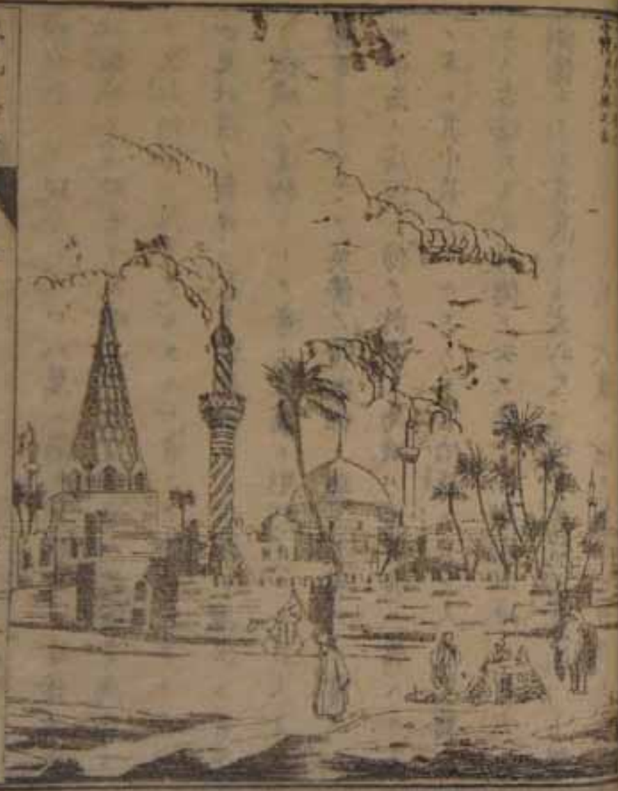
東洋言略 卷三 巴比倫

都城ノ燒キ無量ノ珍寶官女ト共ニ火ニ投シテ内ニ 六百年前 是ヨリレノ巴比倫又盛大ニ至リ巴比 七年前 國ノ獅ノ數代ノ王皆版圖ノ擴ハ四隣ノ屏存 今ヲ陷シ數萬ノ猶太人ノ内ニシテ此兩河ノ邊ニ置ケ リ又埃及ヲ攻撃シテ其都府ノ燒夷セシニ有リ其後 勢漸ク衰弱シ終ニ比耳西亞ノ為ニ蠶食セラレ幾クナ ラスレテ居魯十王ノ為メニ凶ナルヨバタダト府ハ 地華里斯河ノ水濱ニ在テ現今此地方ノ首府トハ内地 ト比耳西亞印度地方トノ交易場ニテ往時回教ノ盛ナ ル時其洋王ノ都ヒレ所ニシテ其版圖ハ亞細亞歐羅巴 亞非利加ニ跨リ當時盛大ヲ極メタル都城ナリシ其