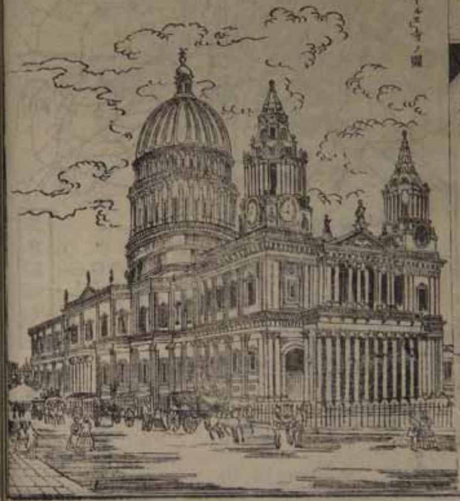
ワシントン州ノ州

數盛シテ人カヲ省ク事夥シク數年前之ヲ算計 スルニ大約七億二千餘萬ノ人カニ代用スルニ云フ 是皆衣食ノ費盡シテ人人口ト謂ベシ