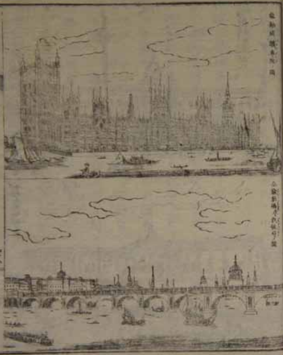
横濱開港後之風景

觀ヲ為ス能ハザルヲ憾ム、此近傍罷勤捕、操、 巨大ノ銅標アリ高サ三十四間許内、煙突階、 上ニ登ルヲ得ベシ上ニ大ナル寶庫ヲ安置、今去ル 一、百五十年前此府田祿ニ罹リ一萬三千戸ノ焼亡、許 多ノ死傷アリシヲ以テ之ヲ追弔スル為、其火ヲ發セ シ所ニ建設セシモノナリ○「トク」ハ、雖廢レ、建築ハ 所、城晏、シテ以利沙伯女王茅嘗テ之、任セリ厚 々發燈ノ古色ト共ニ歷代ノ史跡ニ關スル遺跡數多ク 存セリ、古今ノ武庫ニ用ヒ并ニ古代ノ兵器諸モノ 衣冠等ノ類々其他收稅局造幣局兒銀局郵信局商會場 及、鎮長、 等ノ築造皆極メテ闊