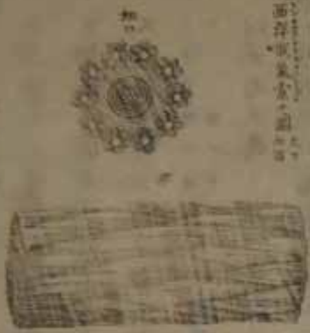
大西洋電氣線ノ圖

ト快シク方々ク畫スト 雖モ變廢シテ止ミシガ次 第ニ試驗ヲ重キ乃チ二十 九年前ニ於テ巨万ノ財ヲ 撤チ漸ク其功ヲ奏スルニ 得テリ然レニ久シカラズ