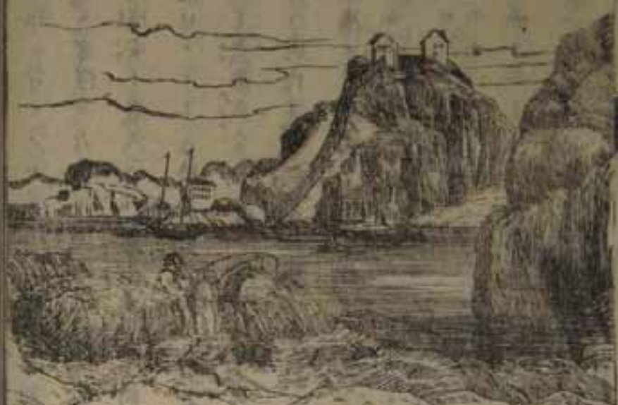
圖ノ以 漢江ノサトヘテスルヤ

極北ノ都府ニシテ 北緯七十度四十分 ノ地ニ在リ盛夏ニ 箇月ノ間太陽常ニ 没ス異常ニ溫暖 ナリ其間魯國ノ商 船多ク來リテ生産 ノ鰵魚魚脂獸皮等 ヲ輸出、秋冬ニ日 間甚ク短ク終ニ八 九旬ノ間暗夜トナ