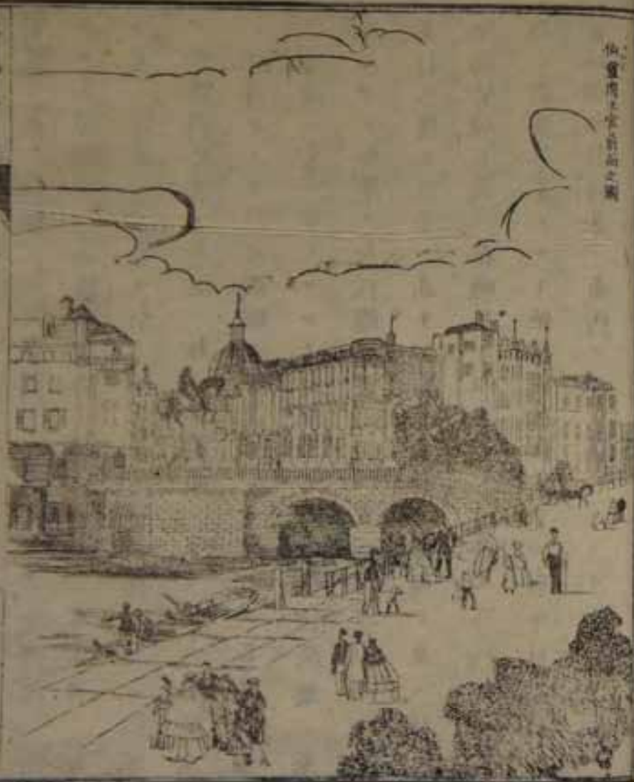
伯靈府上宮前街之圖

巴耶丁堡州ハ大率普國ノ中央ニシテ埃多クハ平坦ノ 屬ニ開砂磧ノ原野有リ即チ普國基本ノ地ニテ京城伯 靈此部内ニ在リ○伯靈ハ全國ノ首府ニシテ人口七十萬 二千餘アリ方今日耳曼政府ノ在ル所ニシテ其壯宏ナル 亦全國ノ第一ナリ 特府ロイヤン府等ノ小都會ヲ合併シテ一大府ヲナセ レモノリリ味哩持二世ノ時ヨリ更ニ其觀ヲ新ニシテ隨 ノ今日ノ繁榮ニ赴ケリ四周平原ニシテスブリ河ノ西 岸ニ跨リ外郭ノ周圍凡ソ四里餘ナリ城門ノ設ケ其 規模皆壯麗ニシテ巴耶丁堡門ノ如クハ銀鍍ニシテ石柱 直立四丈二尺ニ達シ上ニ女神ノ騎馬ニ駕スル銅像ヲ