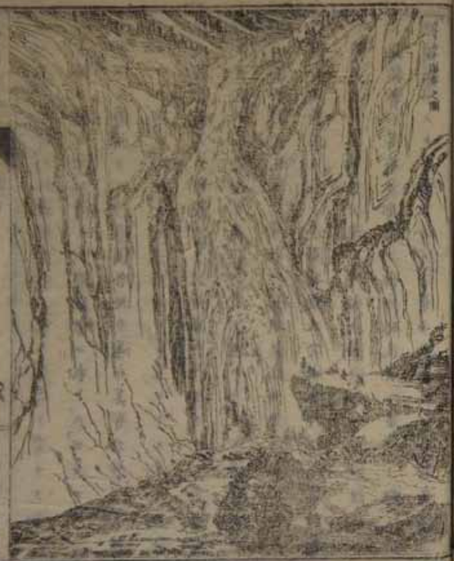
東洋通志 卷六 文部省

然、近世一至リ勉メテ菽麥ノ類、種々、開キ其 得ル所亦少ナラズ然、内地及西北部、都テ穀類ニ 乏シク毎ニ他邦ヨリ之ヲ輸入ス、ト雖、凶年ニハ樹木 ノ皮ヲ粉末トシ麩色ニ和シテ食フニ至ル又山地ニ至 テハ所課氷田ヲ捕スルモノ多ク常ニ水雪ヲ堆積シテ 萬古融解ス、ト無シノ國內湖水ノ數甚衆ノ、他國ニ 比、其ノ湖中腐爛湖、美湖等ヲバテ首トシ其 他數々、一遼、ヲバ川流亦多シ、湖ハ大河ヲ為スニ 至テハ其中カ、タ、タ、等ヲ以テ最トス、カ、河ハ原ヲ 那威ノ山中ニ發シ加余羅斯達ヨリ威那湖ニ注ガ、乃チ 一、河トシテ六箇ノ瀑布ヲ為シ又開靉堡ニ傍ラテ