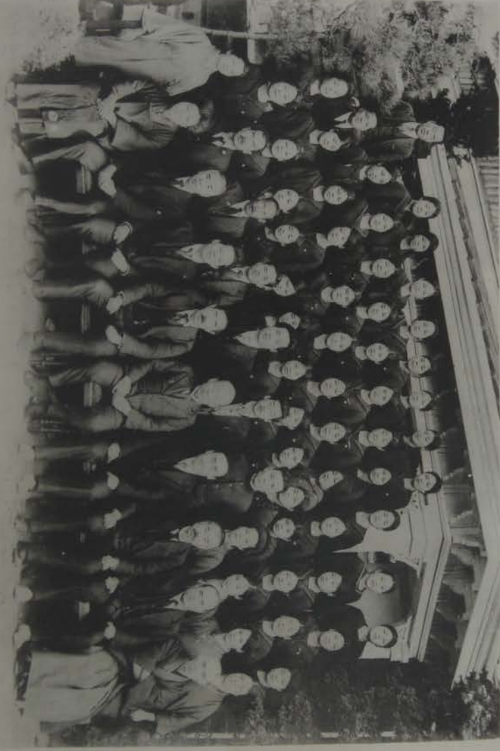
二の共(月三年六和昭)生業卒回一十第科本