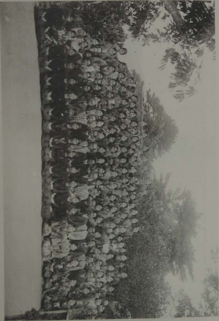
茶屋川會樂會同月十年六和昭