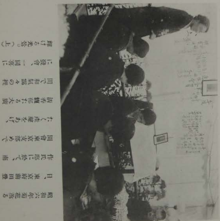
昭和六年菊花落る 日、東京府前田豊 作氏邸に於て、南 園會東京支部めで たく産聲をあげ、 清香飄然たる大廣 間て和氣識々の裡 に慶會、一同喜に 輝ける光景。(上)