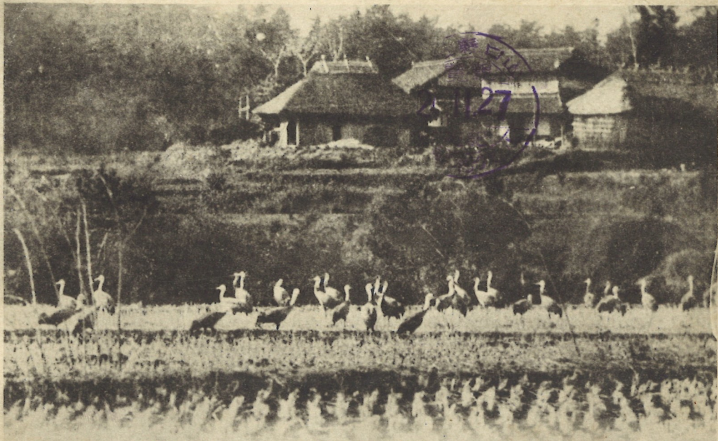
ス居群迄ニ下軒家人リヨニ惠恩ノ代聖ノ鶴野ルス意注モニ音ルツ落ノ露