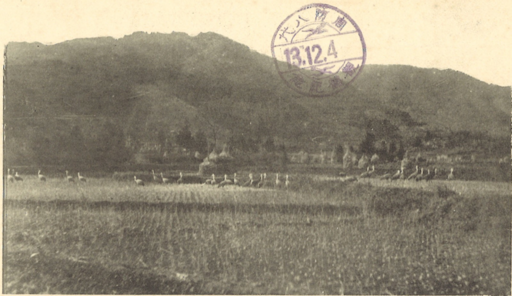
(行發會護保鶴野村代八郡毛熊)