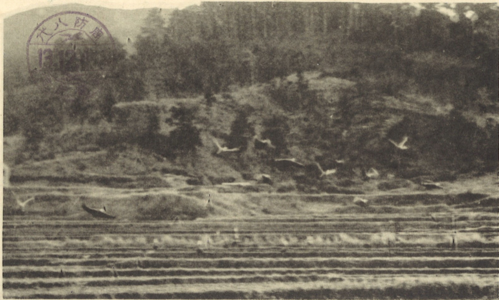
(村發會護保鶴野村代八郡毛熊)