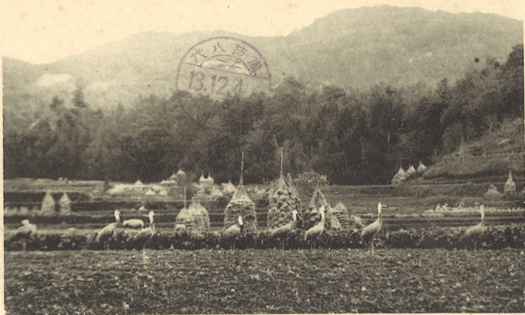
(行發會護保鶴野村代八郡毛熊)