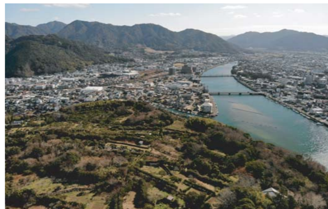
現在の様子

江戸時代後期（天明8年（1788））の絵図を見ると、島の東側では陸続きとなり、西側では鋭利な形で島の地先が拡張しています。これは明和6年（1769）から始まった開作（水面を埋め立てて新たな土地を作ること）によるものです。この開作は洪水との戦いの難工事であったようで、松本川河口は砂の堆積が激しく、既にこの頃には雁島周辺はほぼ陸続きの状態になっており、これを取り込む形で地先を埋め立て、後の新川となる土地が形作られたものと思われます。こうして江戸時代の後半には雁島は開作によって陸地の中に姿を消し、増大した萩の人口を支える一大農地となり、小字に残る「雁島」「開作」にその名残をとどめるだけになりました。