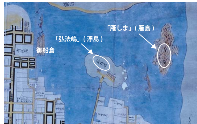
江戸時代中期（宝永6年）の絵図に描かれた雁島、萩城下町絵図（萩博物館所蔵）部分