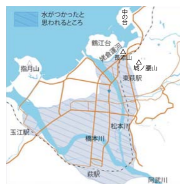
「さる年の大水」（1836年）の時水に浸かった所

つづいて、嘉永3年（1850）にも、再び萩の城下は大洪水の被害を受けました。13代藩主毛利敬親は家臣に求めた対策を自分の目で確