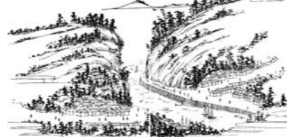
姥倉運河の図「八江名所図画」

運河を掘った時の土砂は恵美須ヶ鼻造船所敷地の埋め立て、また岩石（玄武岩）は防波堤の築造に使われました。