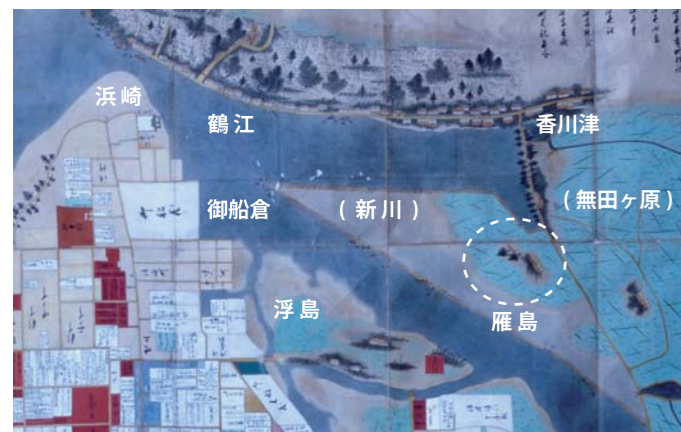
江戸時代後期（天明8年）の雁島開作後の様子、萩城下町絵図（山口県文書館所蔵）部分