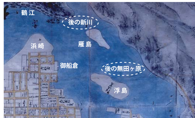
江戸前期（天和年間）絵図に描かれた雁島、萩城下町地図（山口県文書館所蔵）部分