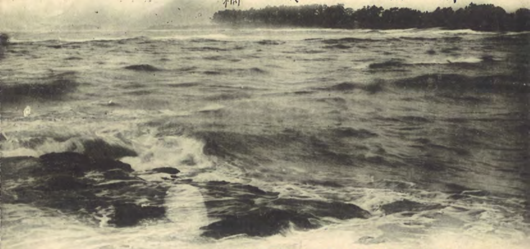
ANGRY WAVES OF SEA HIYUGA, HIYUGA.