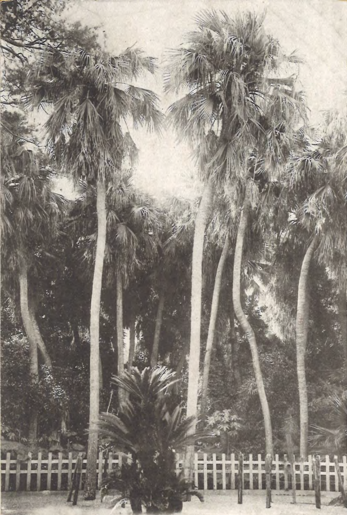
日向青島御社前の蒲葵樹