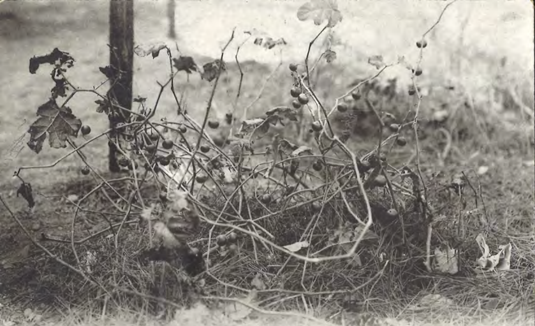
ス ナ 銀 金