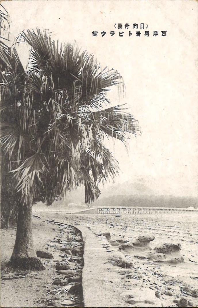
(島青向日) 樹ウラビト岩男岸西