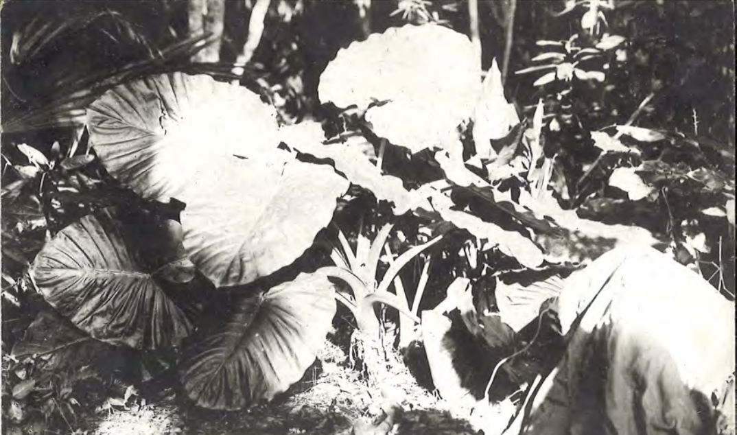
(科星南天) モイズワク (物産の島青南日)