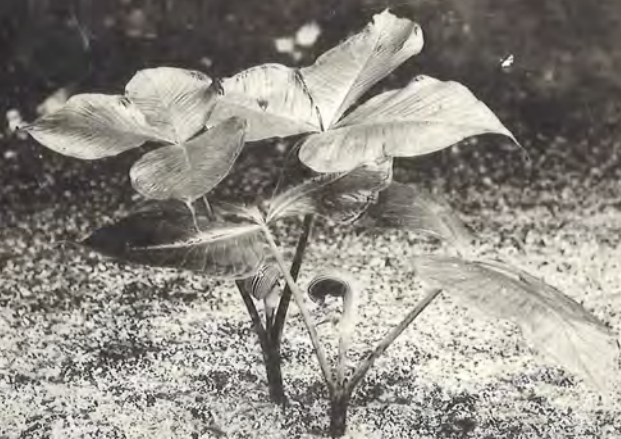
(科星雨天) ミフアシサム (物種の島青向日)