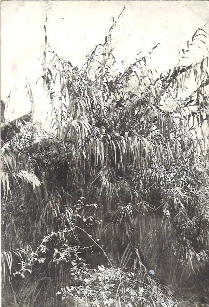
(科本木) クチンダ (物植の島青向日)