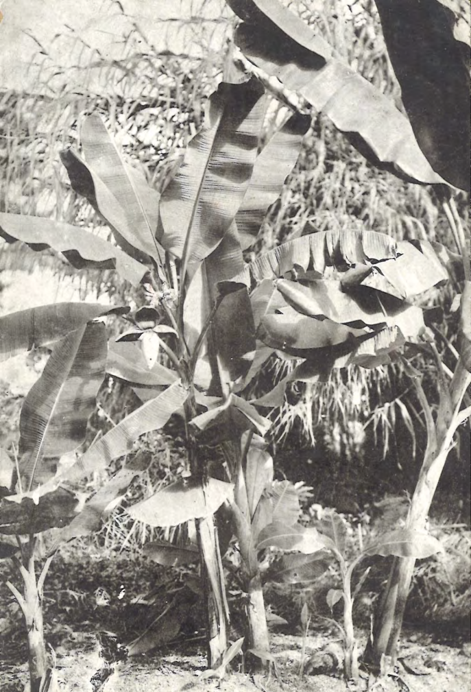
(科蕉芭) ナナバ (物植ノ島青向日)