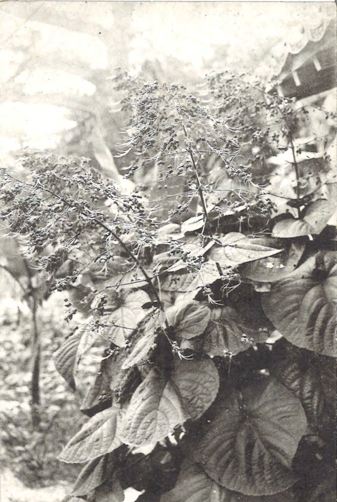
(科 馬 雜) リギヒ (向日青島の植物)