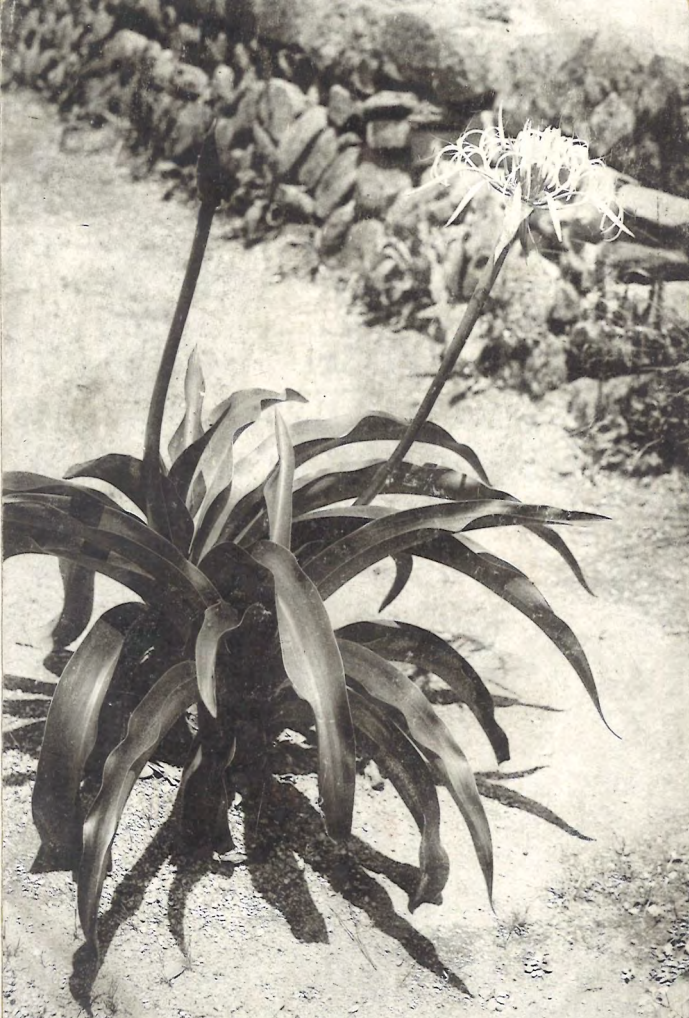
(科蒜石) トモオマハ (物植の島青向日)