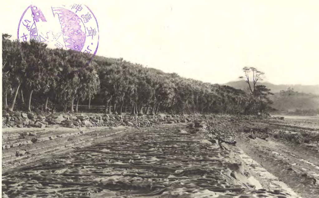
青島北海岸一ノ部