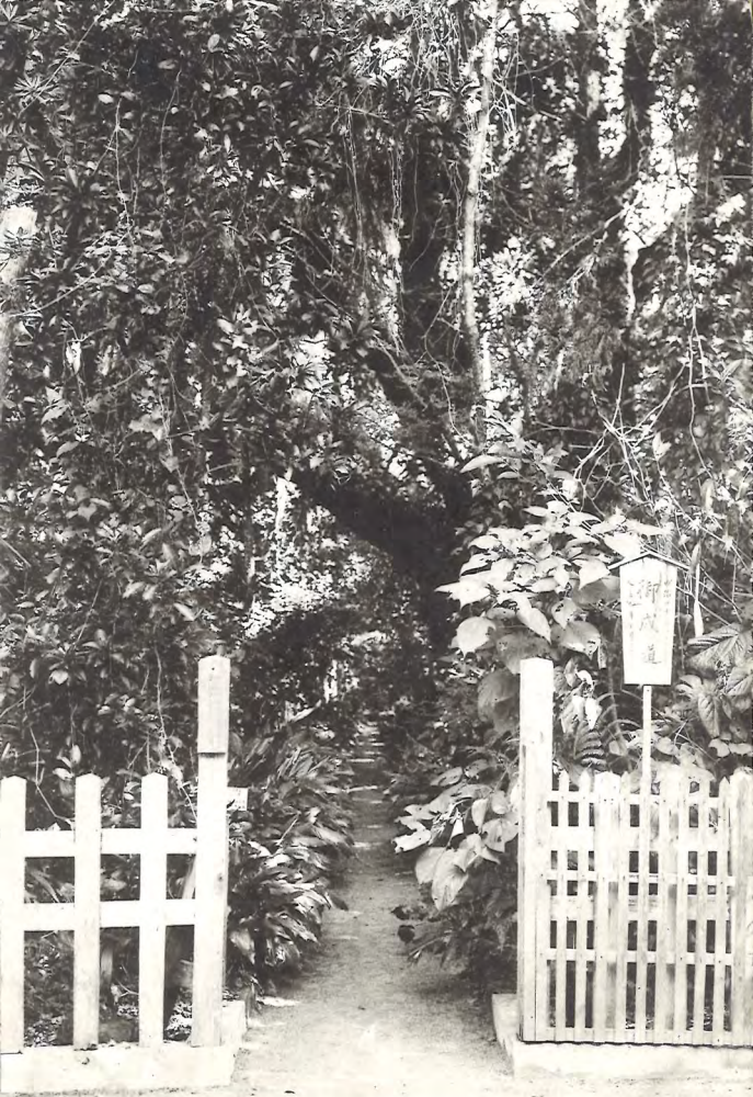
日向青島内御成道