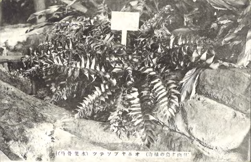
(科骨籠水) ツテソブヤニオ (物植の島ま向日)