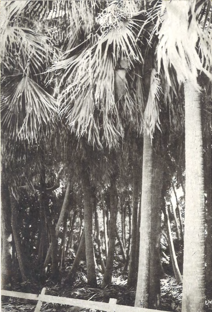
(科 閩 棕) 樹 葵 蒲 生 密 (物 植 の 島 青 向 日)