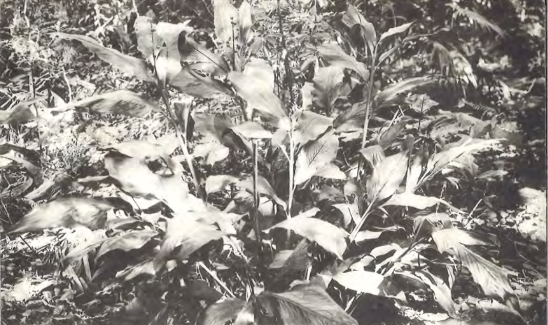
(科 荷 裏) シラケタマクノオア (物 植 の 島 青 向 日)